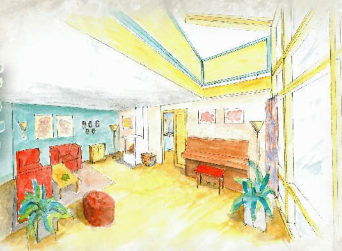
Illustrert av interiørarkitekt MNAL, Berta Henden, Sandane

Passiv solenergi vert utnytta ved store vindauge og bruk av tunge material som stein/torv og betong som lagrar varmen.