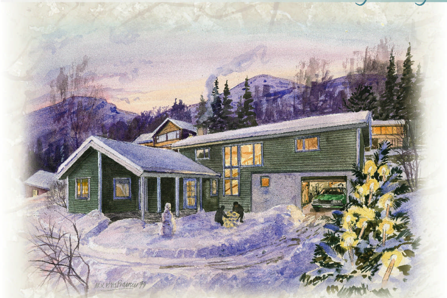
Akvarell Magne V. Kristiansen, Stryn

S tort, praktisk hus med 4 soverom og utleiehusvære. Tilpassa rørslehemma. Inngang direkte frå garasje. Overbygd inngangsparti.